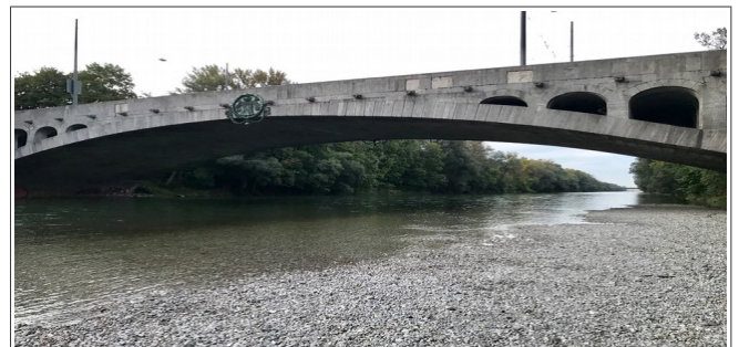
Bei der Max-Joseph-Brücke Blick stadteinwärts